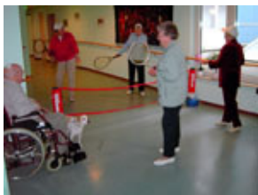
1. Platz: Werner Kölgen (Koblenz) für das Foto „Tennisduell im Seniorenheim“

Dem zweiten Aufruf des DTB zum Fotowettbewerb „Deutschland spielt Guerillatennis!“ folgten wieder unzählige skurrile und lustige Fotoeinsendungen und man wundert sich, wo in Deutschland überall Tennis gespielt wird. So zeigen die Siegerbilder eindrucksvoll, wie einfach im Seniorenheim, auf einem Gepäckband am Flughafen, in der Badewanne oder auf dem Hausdach die Sportart ausgeübt werden kann. Wir bedanken uns bei allen Teilnehmern, die solch ungewöhnliche Tennismomente im Bild festgehalten haben und gratulieren allen Gewinnern.