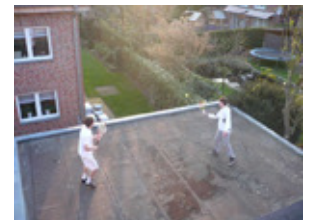
4. Platz: Annette Giesen (Münster) für das Foto „Auf den Dächern von Roxel“